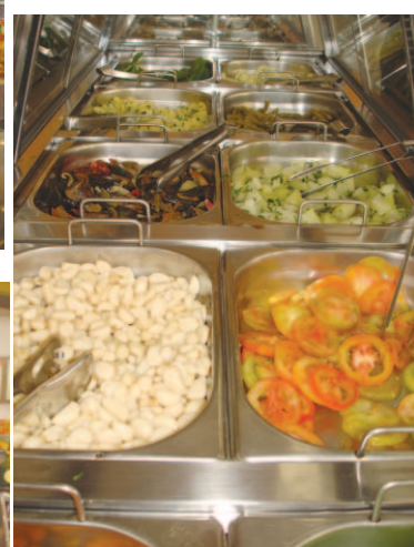
...toda a variedade, em frios e saladas do Restaurante das Estâncias. Venha Conferir!!!